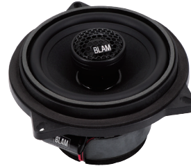
BM 100 FS 希望小売価格(ペア) ¥28,600 税抜価格 ¥26,000